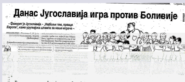
Politika', 17 Korrik 1930

-Sot Jugosllavia luan kundër Bolivisë -Jugosllavia është favorit – “Ekipi më i mirë, të parët e Evropës”, shkruan shtypi i Uruguait për lojtarët tanë.