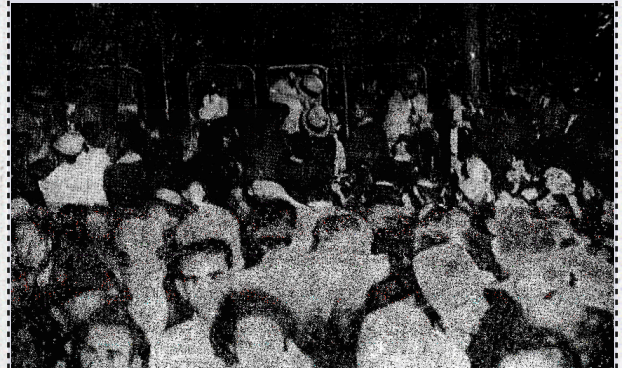
Politika“, Shtator 1930., br. 8018 – godina XXVII

“Mijëra adhurues në pritjen e reprezentuesve tanë në stacionin e madh hekurudhor në Beograd”.