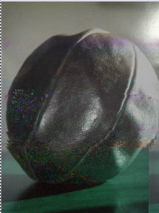
Zupanja – koljevka hrvatskog nogometa, Zupanja, 2005.