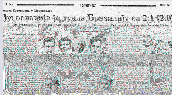
Politika, Beograd, 15. 7. 1930.