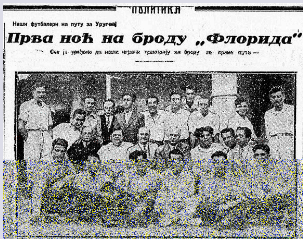
Politika', 26. 06. 1930, br. 7950 – godina XXVII